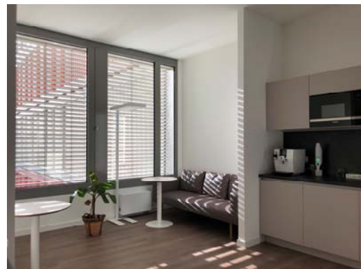
Blick in die Teeküche